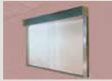
Perde, yan raylar