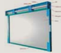
Sarım kutusu ve destekleri